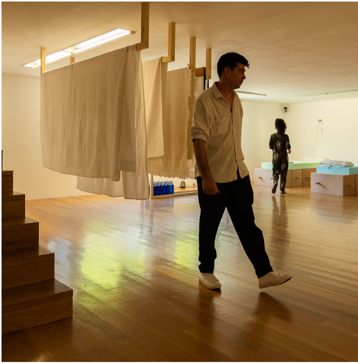
Berio Molina: Dislocación , CGAC, Santiago de Compostela, 2022. En colaboración con Alejandra Pombo Su e Calís Pato.

La muestra construye un escenario, una instalación inmersiva, donde se invita al visitante a habitar este espacio para entender la hibridación entre especies y la relación entre lo humano y lo no humano como una opción posible para estar en el mundo.