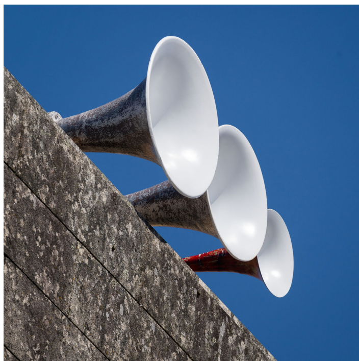
Berio Molina: Dislocación , CGAC, Santiago de Compostela, 2022.

O traballo de Berio Molina estivo marcado sempre polo seu forte compoñente de acción combinado cunha forte aposta polo traballo sobre o son. A súa participación en proxectos tan sinalados como Escoitar.org (2006-2016) dedicados á investigación sonora, Flexo (1999-2004) á acción artística ou Alga.lab á arte dixital (2004-2016) marcan sen dúbida unha traxectoria determinada pola característica colaborativa dos seus proxectos, así como do seu marcado carácter experimental. Ao mesmo tempo, a súa obra caracterízase pola súa compoñente colaborativa e por unir dalgún xeito a investigación