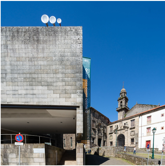
Berio Molina: Dislocación , CGAC, Santiago de Compostela, 2022.

La charca is conceived as an approach to the fascinating characteristics of these minuscule beings. Exploring the physiological facets of these creatures from a fictional narrative and creating new work consisting of sculptures, fabrics, video projection, painting and performance. La charca contains echoes of the ancestral that are formed by that reference to water as an element through Rosana Antolí's own sculptures and the scenic space; a number of electronic musical baselines developed by Pálida and the reference to two coexisting universes: the contemporary, post-apocalyptic one and the ancestral. At each instant, the choreography is a dialogue that jumps from the virtual and digital to the stage setting itself, giving rise to a rivalry between digital and tangible bodies. Sound is transformed into a mantra.