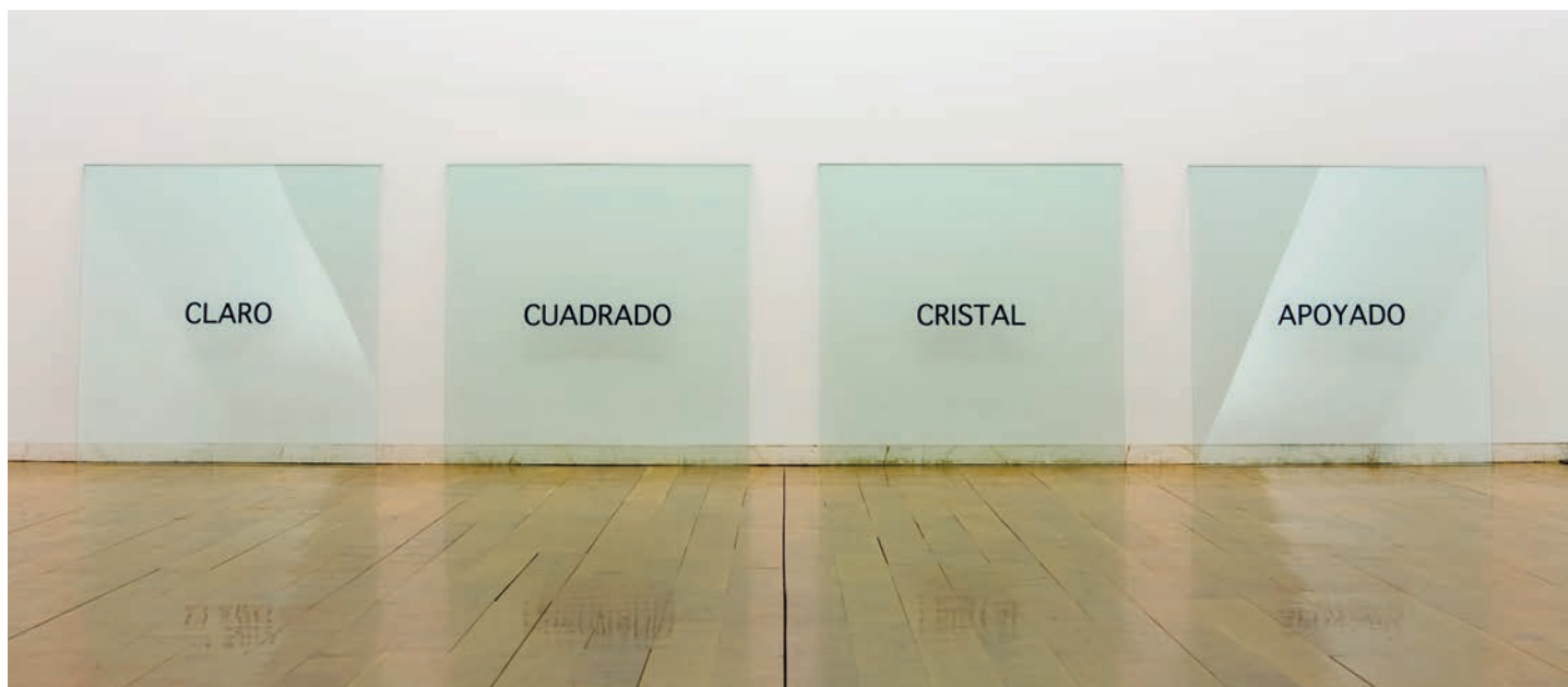
Joseph Kosuth: Claro Cuadrado Cristal Apoyado , 1965. Colección CGAC. © Joseph Kosuth, VEGAP, Santiago de Compostela, 2023

nas artes plásticas. Este cambio de paradigma consistiu en abandonar os medios tradicionais (a pintura e a escultura), criticar e cuestionar a autonomía da arte, introducir ou reivindicar novos elementos significantes na representación (a linguaxe, a fotografía, as prácticas performativas etc.) e, en definitiva, establecer unha forma completamente nova de se relacionar coa realidade. Unha realidade que, naqueles anos, experimentaba cambios estruturais como foron a revolución cultural de maio do 68, a emancipación da muller a través da segunda onda feminista ou os procesos de descolonización.