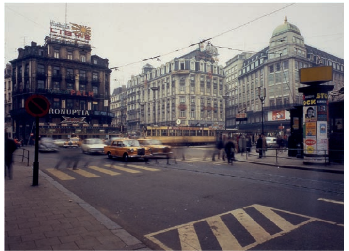
David Lamelas: Brussels (11:30 a.m.) , 1969. Colección CGAC

Desde este punto de vista o ánimo deste proxecto é dobre: por unha banda, pretende crear contido e pór en valor unha parte da colección, pero, por outra, tamén aspira a dinamizar un debate e xerar unha crítica institucional; unha intervención que axude a identificar os retos do CGAC para o futuro e que contribúa a afinar e articular, aínda máis, a súa misión como museo e a súa responsabilidade ante a sociedade.