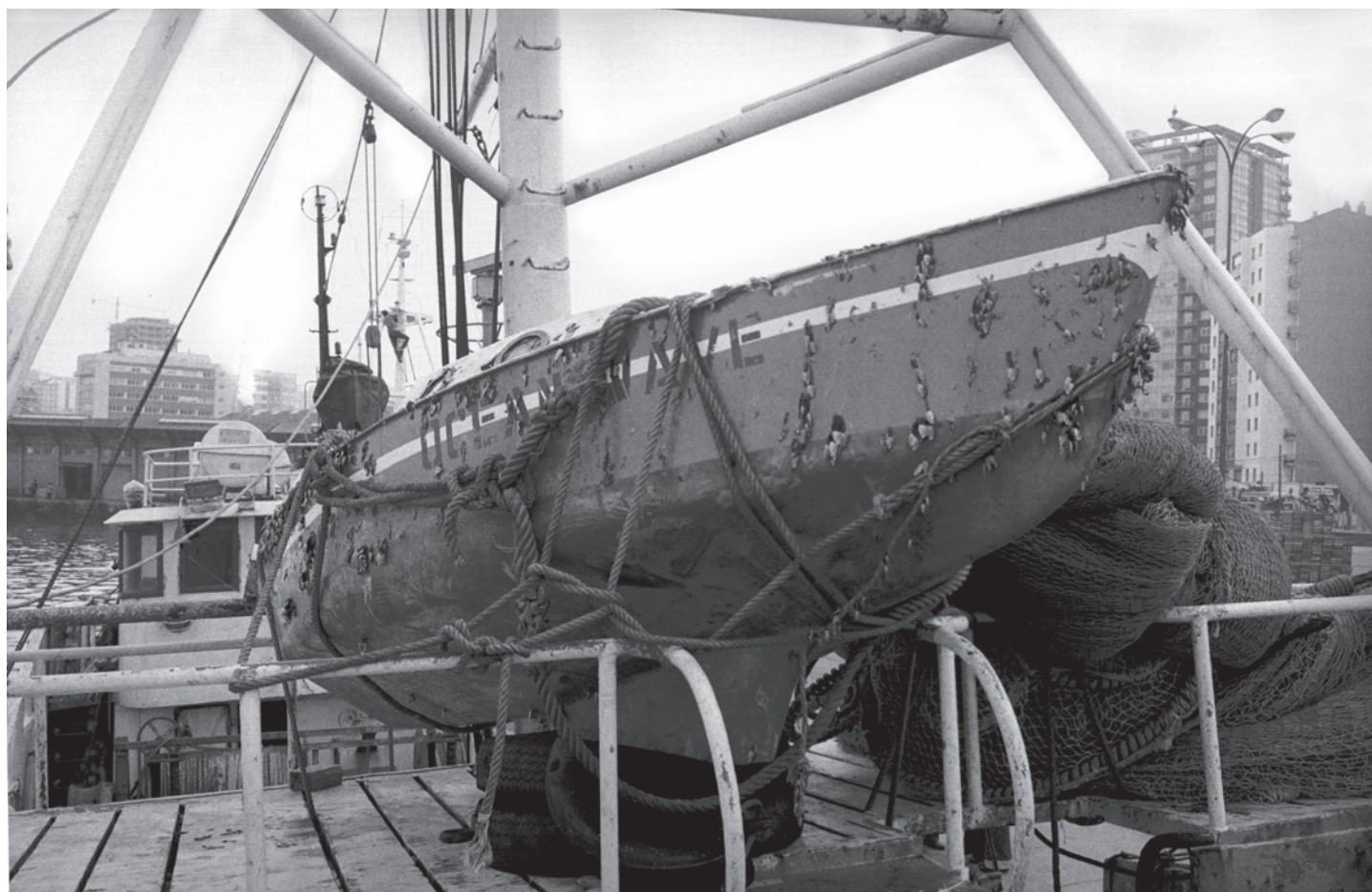
Alberto Martí Villardefrancos: fotografía del velero Ocean Wave (28 de abril, 1976), en el que Bas Jan Ader desarrolló su proyecto In Search of the Miraculous . Colección particular, Santiago de Compostela. © Alberto Martí Villardefrancos, VEGAP, Santiago de Compostela, 2023