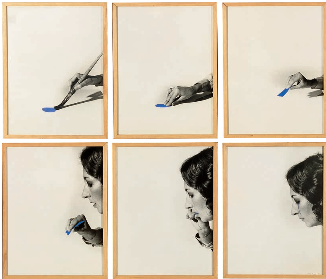
Helena Almeida: Estudo para um enriquecimento interior , 1977. CGAC Collection

experiences of conceptual artists. The timeframe we propose refers to the origins of the movement in 1965, illustrated by work Claro Cuadrado Cristal Apoyado (Clear Square Glass Leaning) by Joseph Kosuth, and to its (provisional) closing exemplified by the iconic project In Search of the Miraculous made by Bas Jan Ader in 1975.