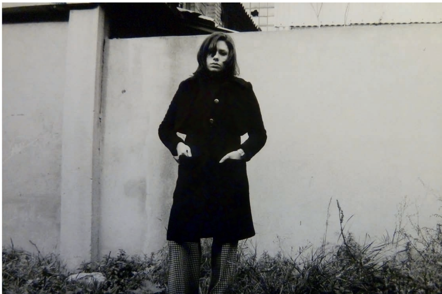
Olga L. Pijoan: Herba , 1973.