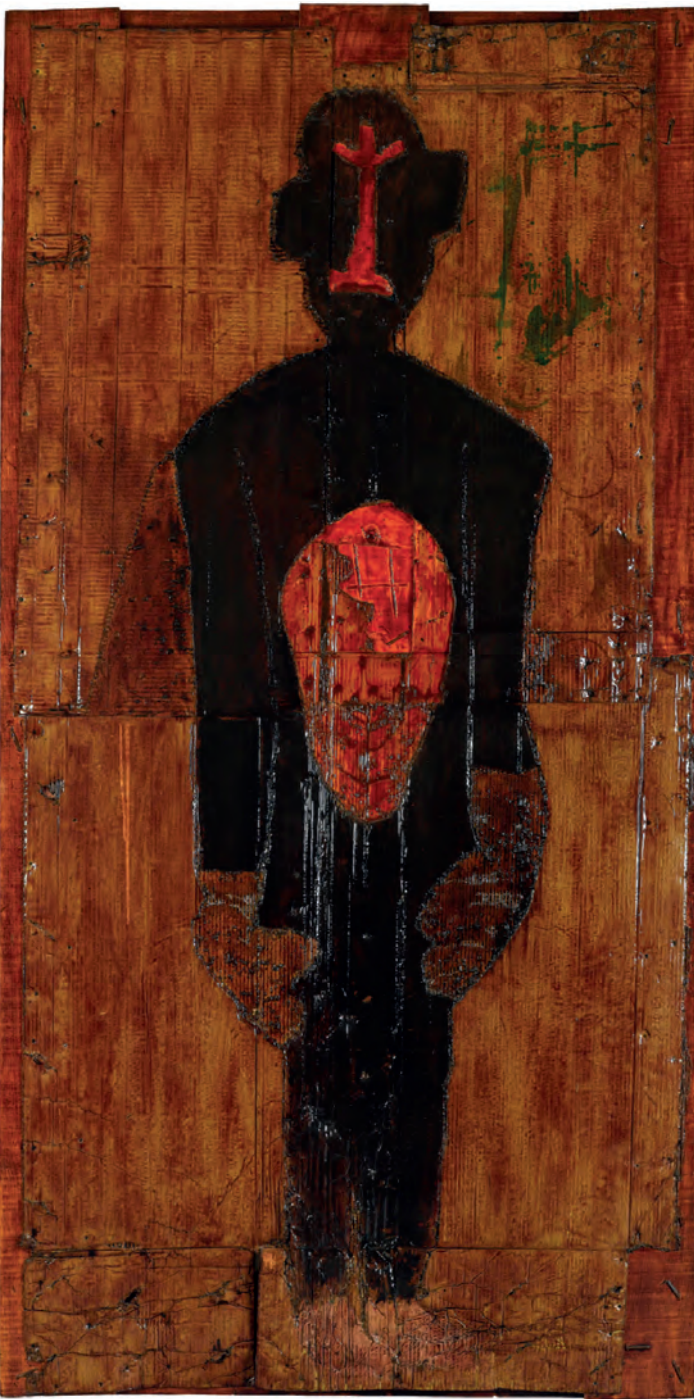
Firme . Madrid, 1986/2012. © Antón Lamazares, VEGAP, Santiago de Compostela, 2024

en el silencio, certificar que en su esencia conoceremos el más puro sentir. Perseguir sus designios es una forma de responder a la inquietud de los días, al ruido incesante que nos asedia por doquier. Para posibilitar ese acercamiento a nuestro interior nos imponemos serenidad, presuponemos que, al liberarnos de estímulos tentadores, nos acercaremos al poder de la verdad. La creación artística encierra en sí misma la respuesta al silencio; se reviste de una sofisticación que otorga a cada obra licencia para absorber una parte de su espectro. Velar por la pervivencia de un saber que conserva en sí la enzima de la tranquilidad plena conlleva un respeto por los sentidos que han perpetuado la experiencia del embeleso.