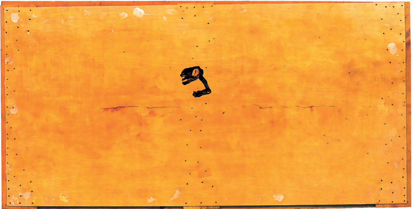
Juan Belmonte matador de toros . Madrid, 1986/1992. © Antón Lamazares, VEGAP, Santiago de Compostela, 2024

sufís. A luz da nosa infancia, das douradas mañás de outono, deses invernos que se volvían pardos e diluían a definición das formas, a que en primavera xurdía resplandecente como anunciando a chegada dun verán que traía intensidade incandescente e sombras contrastadas; esa luz, que exaltaba as cores nos campos mediante ricas tonalidades, dos verdes aos laranxas, dos ocres aos terras, entre carballos e hortos, nun crisol de espectros cromáticos, está toda na súa obra.