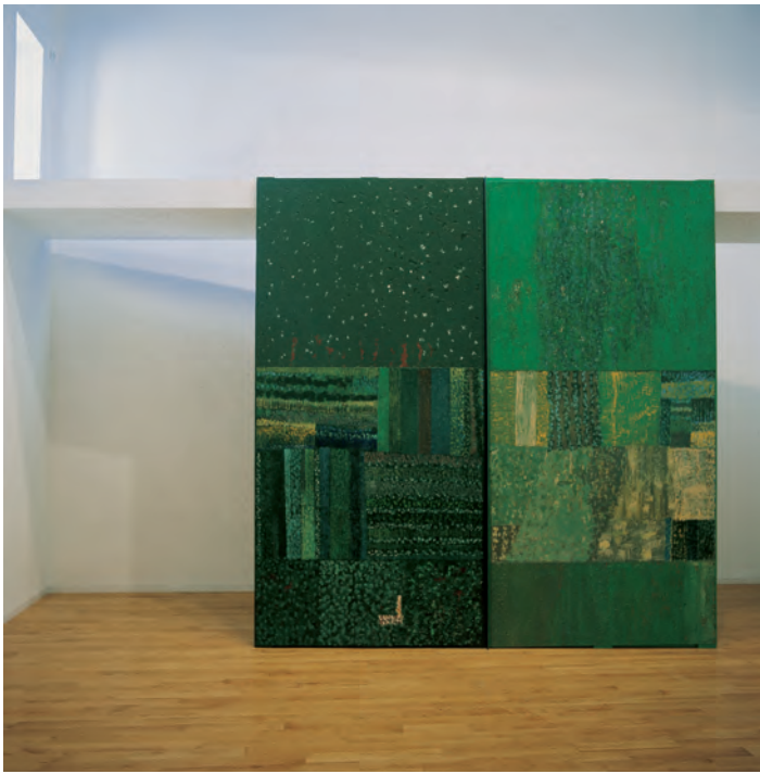
Gracias do lugar (Eidos de Bama) . Santiago de Compostela, 1996. © Antón Lamazares, VEGAP, Santiago de Compostela, 2024

que se elevaba para despertar nel o poder da sensibilidade creadora. A sabedoría do traballo que Lamazares regálanos hoxe, neste vasto percorrido seu, é a demostración de como unha contemplación atenta e sensible pode funcionar como réplica ás máis profundas experiencias de transcendencia. A pureza que hoxe podemos contemplar na obra de Lamazares transpórtanos a un rexistro de profundidade e esmero que conduce ao máis estimulante exercicio de contemplación.