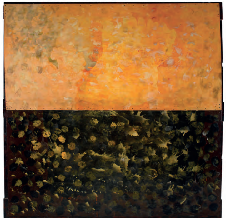
Túzaro, 1986/1992. © Antón Lamazares, VEGAP, Santiago de Compostela, 2024

Ser humano : la definición más sencilla y apta para entender el significado de la sensibilidad. Una definición que nos remite a la comprensión de un atributo tan exclusivo de lo humano que lo acompaña en todas sus manifestaciones y relaciones con sus congéneres. Atención que se traduce en una aguda curiosidad por el mundo. Los estímulos son diversos y aluden a diferentes reacciones ante los colores, las texturas, los sonidos, los olores y los sabores, que en