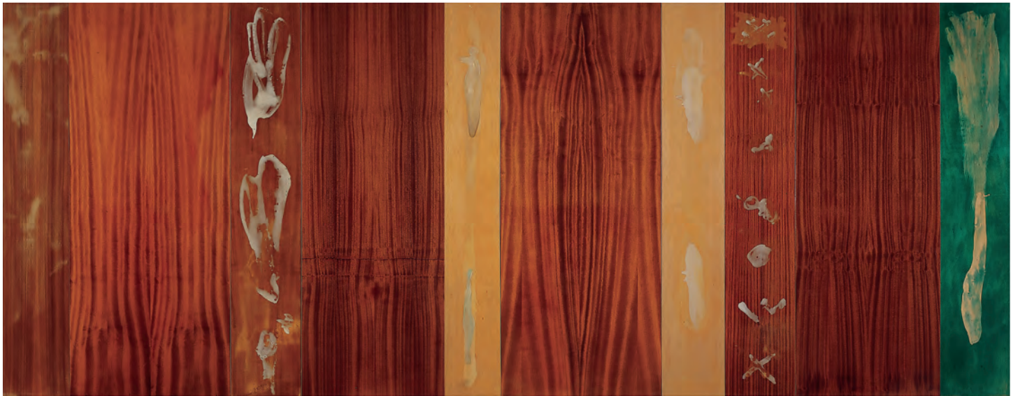
Año de nieves – año de bienes . Salamanca, 1989. © Antón Lamazares, VEGAP, Santiago de Compostela, 2024

su diversidad ensanchan las experiencias sensoriales e intensifican la sensibilidad. Las manifestaciones artísticas son prueba evidente de la conciencia humana como posibilitadora del hacer y del crear.