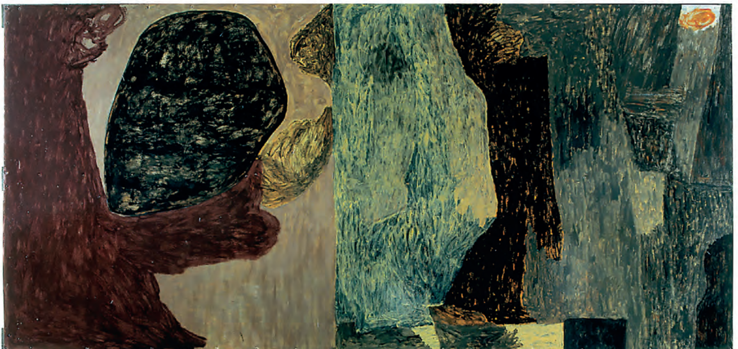
Carnaval en Adelan, 2000. © Antón Lamazares, VEGAP, Santiago de Compostela, 2024

Aspirar a poseer la más plena de las formas lleva implícita una voluntad de silencio, porque solo en el silencio puede residir la más profunda de las verdades. Queremos converger